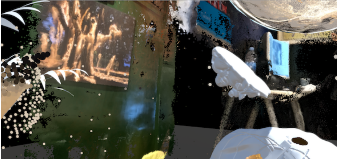
Crédito: Uwe Brunner, Bettina Katja, Chiara Passa y Joan Soler-Adillon. Prototipo "Occultation".

Frictional Forces. Proyecto VR y performance de las artistas Shivani Hassard y Clarice Hilton. Se trata de una experiencia Virtual en que se actúa a nivel analógico sobre el cuerpo, se siente la resistencia de materiales, vibraciones de sonido. El resultado es una experiencia multisensorial.